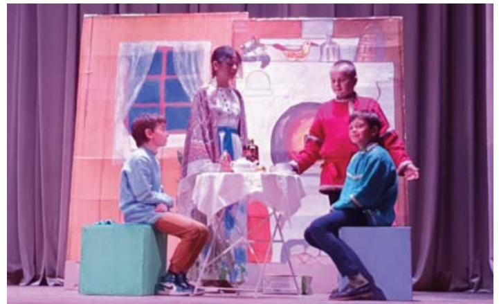
Пасхальная сказка в Дедовском Доме культуры

23 апреля в Истре и Дедовске состоялись праздничные концерты, посвящённые Светлому Христову Воскресению. На концертах присутствовало духовенство благочиния, а артистами были церковные хоры и воспитанники воскресных школ, которые показывали пасхальные сюжеты, читали стихи, танцевали и, конечно, исполняли песни, посвященные Воскресению Христову. Также в рамках концертов прошло награждение победителей и участников конкурса «Пасха красная».