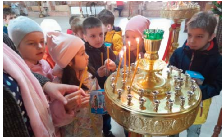
Дети с воспитателями в Мироносицком храме