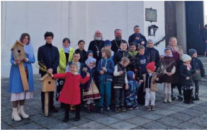
Прихожане храма с новыми скворечниками

1 апреля ежегодно отмечается Международный день птиц – интернациональный экологический праздник. Его цель – сохранение видовой разнообразия и численности птиц. В России этот день является самым известным из «птичьих» праздников. Прихожане Никольского храма деревни Мансурово позаботились об увеличении птиц на своей территории и изготовили новые скворечники – три домика были повешены для заселения скворцами, а синицы выбрали прошлогодние расписные домики.