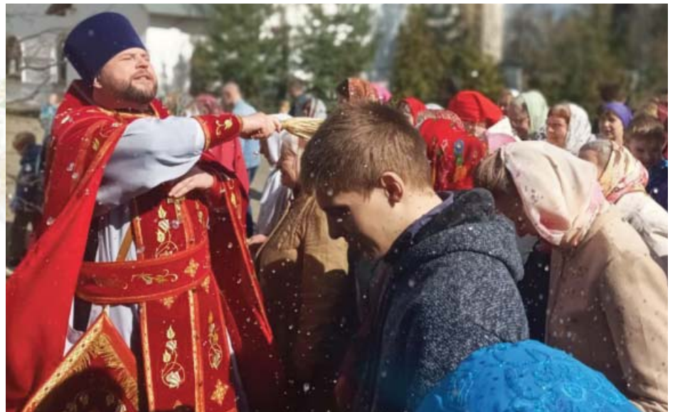
Пасхальный крестный ход в Георгиевском храме города Дедовска

Первое значение – это учение Иисуса Христа, который претерпел все тяготы земной жизни,