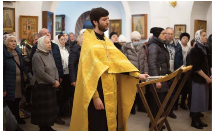
Паломники на литургии в Никольском храме