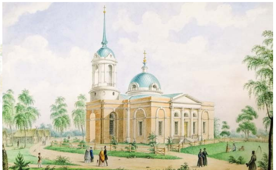
Храм Рождества Христова. Художник Н. Филлов. 1851 год.

От господского дома Кутайсовых до церкви тянулся длинный проспект – прямая липовая аллея, от оврага переходящая в улицу. Эта улица была застроена в начале XX века и получила название Советская, но старожилы ещё долгое время называли её «пришпектом» на манер Петербурга. Через овраг существовал основательный каменный мост (утрачен в советские годы). В праздничные и воскресные дни по этому «пришпекту» из господского дома ездили на богослужение в церковь.