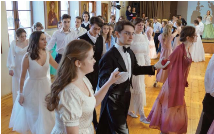
Юноши и девушки – участники Сретенского бала

18 февраля в православной школе «Рождество» состоялся Сретенский бал старшеклассников. На бал были приглашены юноши и девушки из четырёх дружественных школ – гимназии «София» из Клина, школы «Образ» из Малаховки, гимназии святителя Филарета Московского из Лобни и Рождественской школы. Более трёх часов старинные танцевальные ритмы – вальсы, марши, кадрили, котильоны – перемежались бальными играми, литературными загадками и сольными выступлениями.